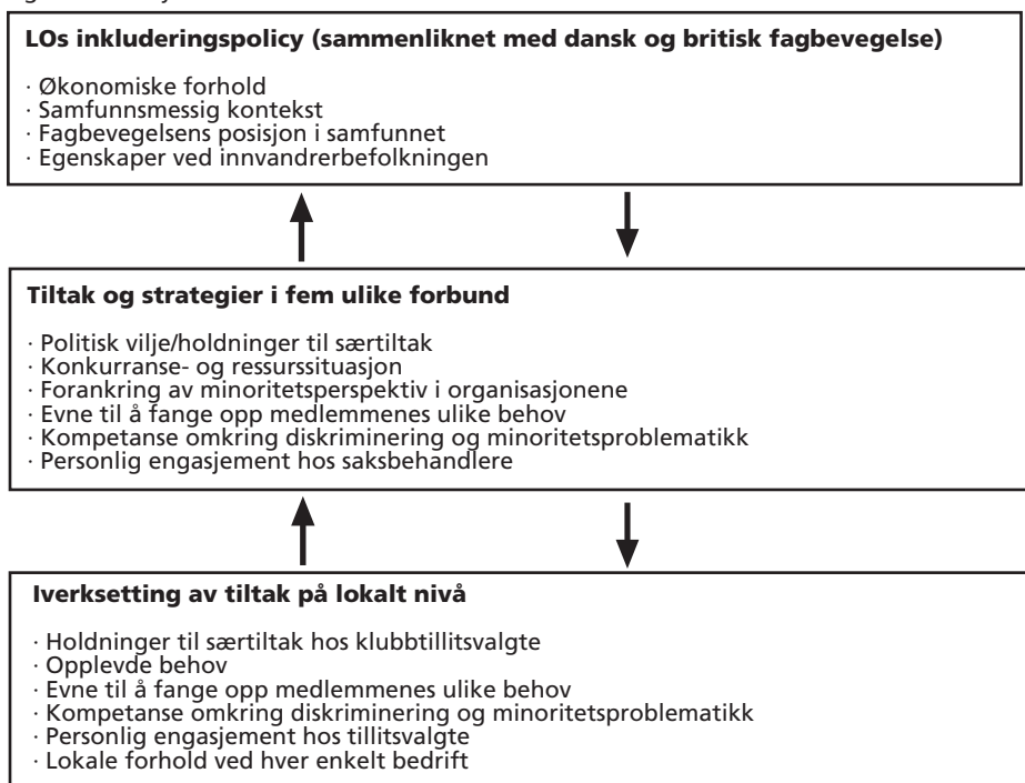
Figur 1.1 Analysemodell